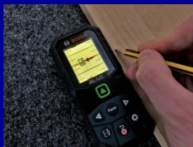
テープメジャー機能